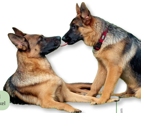
Asti vom Oerier Wald und Bella vom Zisawinkel